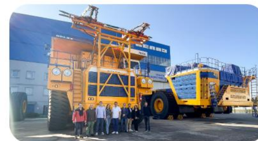
Экскурсия на промышленное предприятие ОАО «БЕЛАЗ»