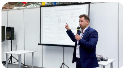
Деловая сессия с молодыми промышленниками Республики Беларусь