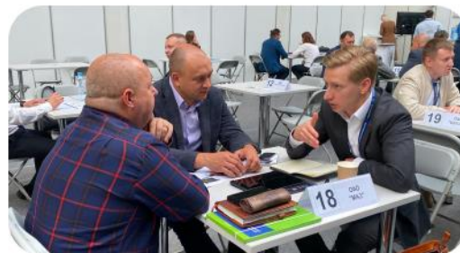
Биржа промышленной кооперации с участием крупнейшими белорусскими Заказчиками