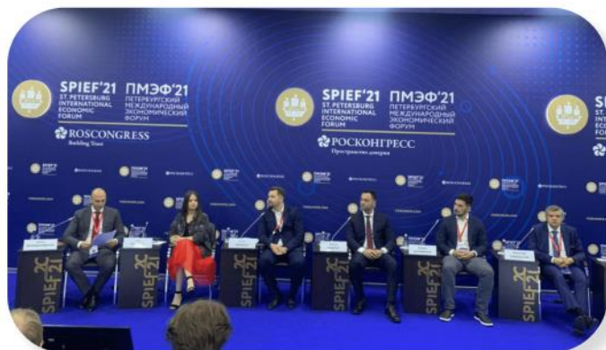
Сессия Клуба в рамках ПМЭФ-2021: «Инвестиционные ниши и промышленные стартапы: диалог с крупнейшими отраслевыми заказчиками»