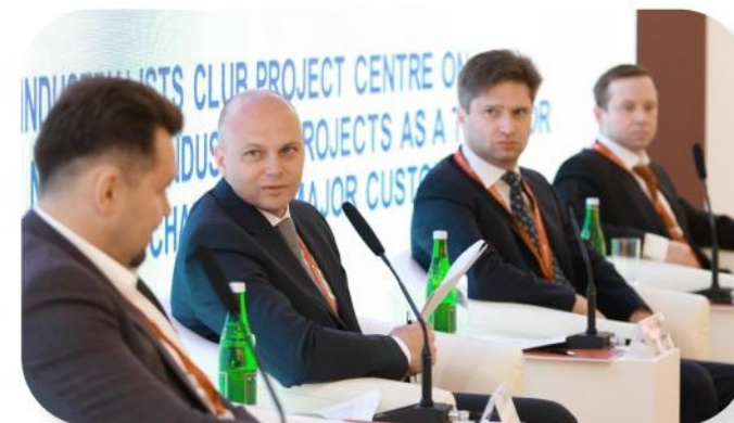
Сессия Клуба в рамках ПМЭФ-2023: «Проектный центр Клуба молодых промышленников по инвестиционным нишам и промышленным проектам как инструмент выстраивания кооперационных цепочек с крупнейшими заказчиками»