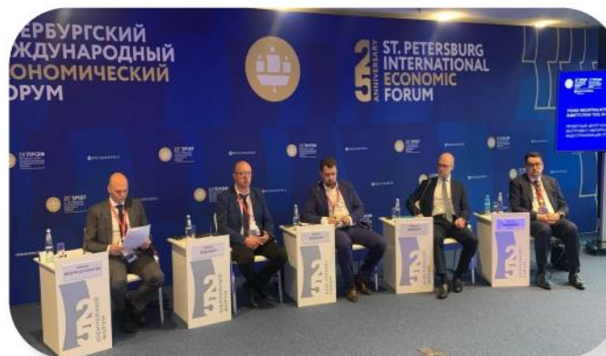
Сессия Клуба в рамках ПМЭФ-2022: «Проектный центр Клуба молодых промышленников как инструмент импортозамещения в новой индустриализации России»